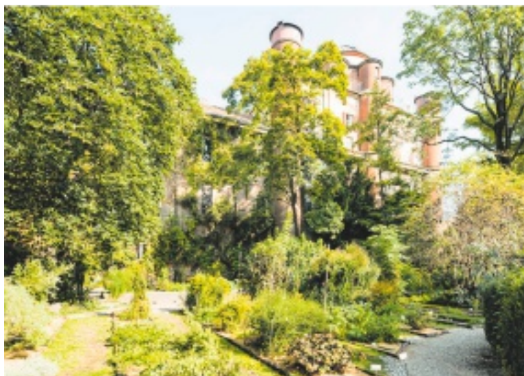
ORTO BOTANICO Tutto pronto a Brera per il prossimo Fuorisalone

no gli showroom coinvolti, tra gallerie d'arte e negozi, che per una settimana proporranno novità di prodotto e installazioni sul tema «Progettare il presente, scegliere il futuro». Il progetto del Fuorisalone è a fir-