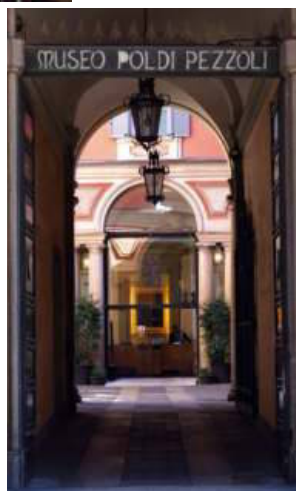
MUSEO POLDI PEZZOLI

29). L'ex sede dello storico marchio Galtruccio, nel distretto dei grossisti milanesi, ospita le novità del brand Moooi, fondato dall'olandese Marcel Wanders. A Life Extraordinary lancia la robotica lifestyle di IDEO, fragranze che rendono interattivi gli interiors mood dell'allestimento, con opere in 3D dell'artista Ada Stokol sugli animali in estinzione e quelle dei digitali Andrés Reisinger e